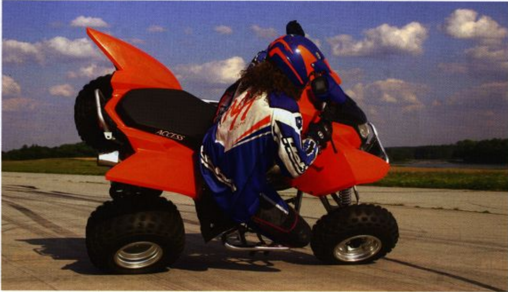
Text a foto: Přemek Vaněk.